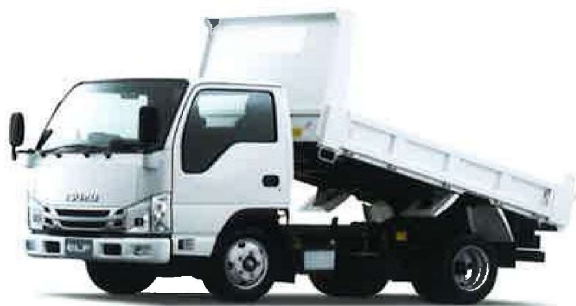
標準キャブ 標準ボディ/強化型/三方開 NJR88AN-EE6AK5