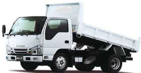
標準キャブ 標準ボディ/強化型/舟底一方開・三方開 NJR88AN-EE5MAD 5AV